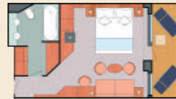
S - SUITE MIT BALKON - 31 m 2