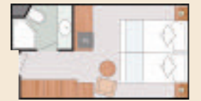
I4 - INNENKABINE - 14 m 2

Bei den obigen Abbildungen handelt es sich lediglich um Kabinenbeispiele.